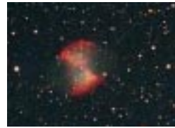
Planetarisk tåge M27

Billederne på denne side er taget fra Risskov nord for Århus. De er optaget gennem en kikkert med en spejldiameter på 20cm. De viser, hvad man kan se med en god astronomisk kikkert under en dansk himmel.